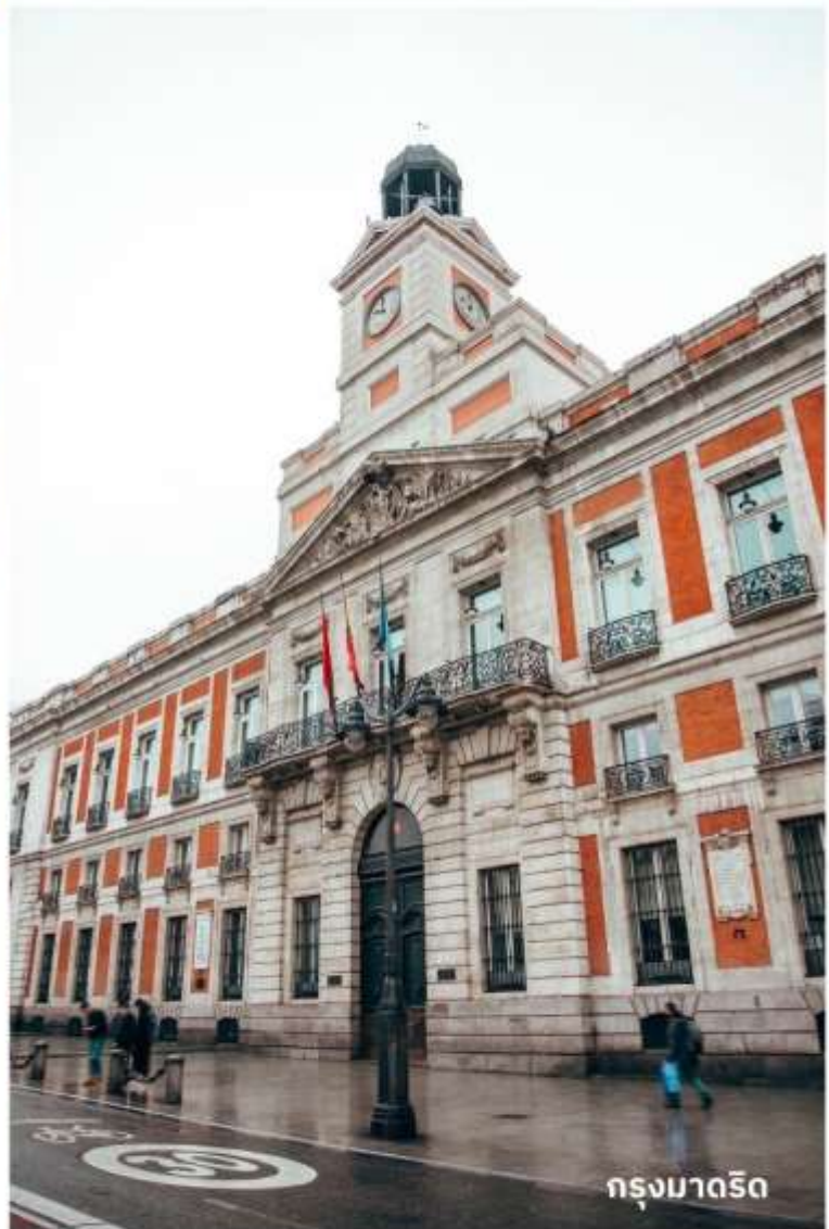
กรุงมาดริด