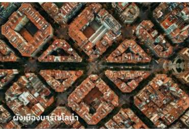
ผังเมืองบาร์เซโลน่า