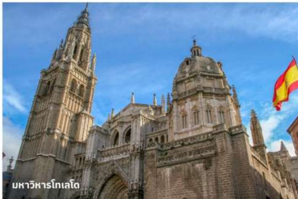
มหาวิหารโทเลโด

จากนั้นนำท่านเดินทางเข้าสู่ ย่านเขตเมืองเก่าโทเลโด นำท่านถ่ายรูปด้านหน้า มหาวิหารโทเลโด (Toledo Cathedral) เป็นมหาวิหารโกธิกที่งดงามที่สุดแห่งหนึ่งในยุโรป และนำท่านถ่ายรูปที่ อัลกาซาร์แห่งโทเลโด (Alcázar of Toledo) ปราสาทที่ตั้งอยู่บนยอดเขาในเมือง เป็นสัญลักษณ์สำคัญของโทเลโด ปัจจุบันเป็นพิพิธภัณฑสถานแห่งชาติ จากนั้นอิสระให้ท่านได้เดินเล่นภายในตัวเมืองเพื่อเลือกซื้อสินค้าที่ระลึกตามอัธยาศัย