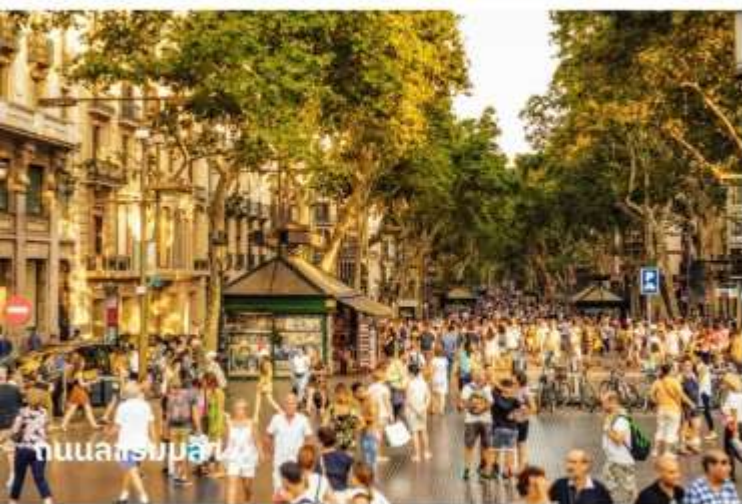
ถนนลารัมบลลา