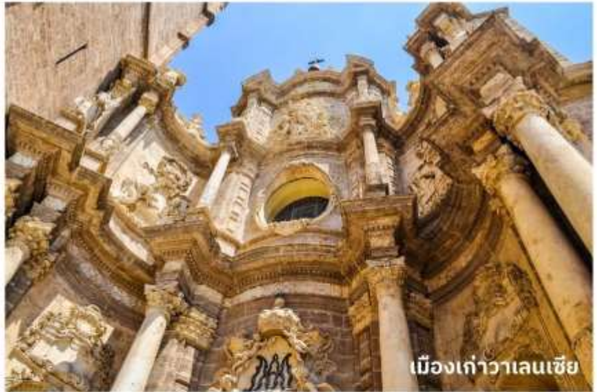
เมืองเก่าวาเลนเซีย