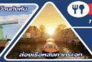
ส่งเรือหลังคากระจก