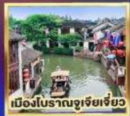
เมืองโบราณจูเจียเจี้ยว