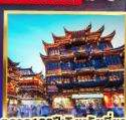
ตลาด100ปีเจิ้งหวงเมี่ยว