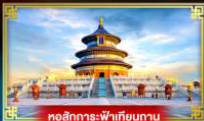
หอสัการะฟ้าเทียนถาน