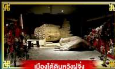
เมืองใต้ดินหวงฟูจิ่ง