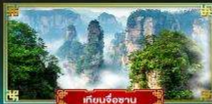
เทียนจ้อซาน