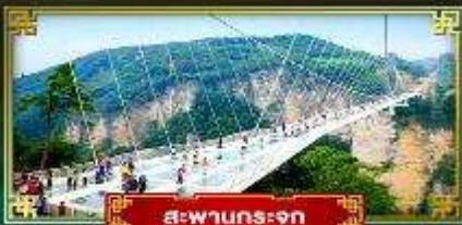
สะพานกระจก

สัมผัสบรรยากาศหมู่บ้านโบราณ ชมหุบเขาอวตาร