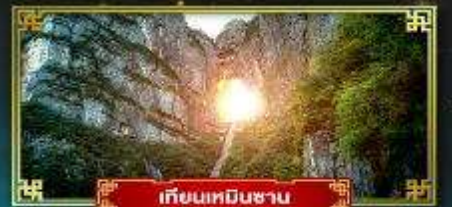
เทียนหมินซาน