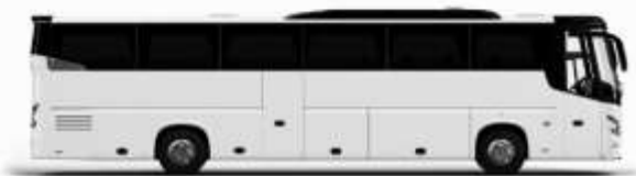
ตัวอย่างรถพลาท 1 ชั้น

ค่าที่พักตามที่ระบุในรายการหรือเทียบเท่าระดับเดียวกัน (ห้องพักละ 2 ท่าน) หากประเภทห้องพักท่านริเวสณาเกินจาก เช่น ริเวสคห้องพักเป็น TWIN BED หรือ DOUBLE BED ทางบริษัทขอสงวนสิทธิ์ในการปรับประเภทห้องพัก เป็นตามที่โรงแรมมีอยู่ โดยไม่ต้องแจ้งให้ทราบล่วงหน้า