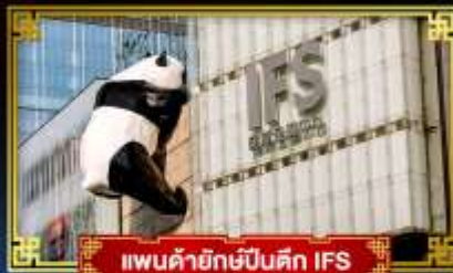
แพนด้ายักษ์ปิงตึก IFS