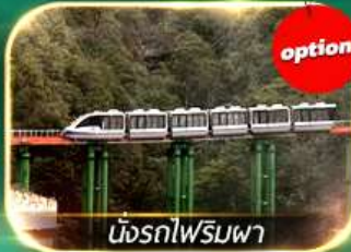
นั่งรถไฟรมพา