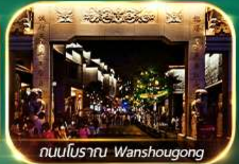
ถนนโบราณ Wanshougong

ตระการตาหุบเขาเทวดาฉีเซินกู่ เช็คอินที่เที่ยงใหม่