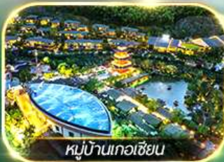
หมู่บ้านเกอเซี่ยน