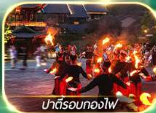
ปาตีรอบทองไฟ