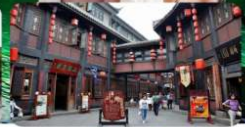
ถนนโบราณเจิ้งหลี่

เมนูพิเศษ สุกี้เห็ด สุกี้เห็ด สุกี้หม่าล่า ซาบูไม้อัน 6 วัน 5 คืน เดินทาง : เทศกาลสงกรานต์