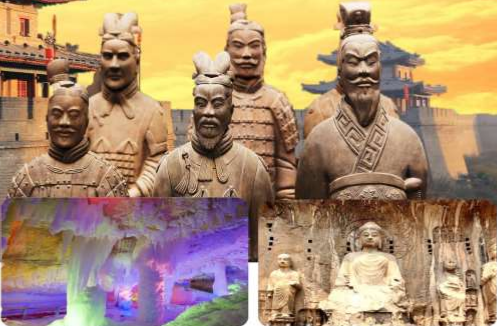
ถ้ำน้ำแข็งหมื่นปี