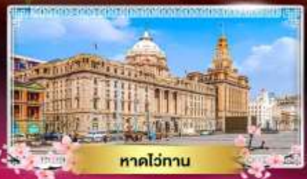
หาดไถ่ทาน

"ชมดอกซากุระนลิบาน ณ แดนมังกร" ล่องเรือทะเลสาบตะวันตก ไข่มุกแห่งหางโจว