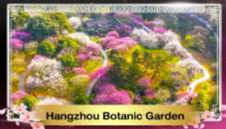
Hangzhou Botanic Garden