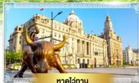
หาดไว่ทาน