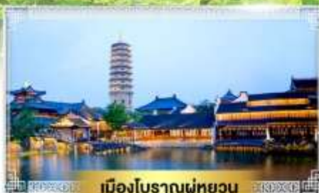
เมืองโบราณฝูหยวน