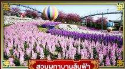
สวนผกานานลันฟ้า