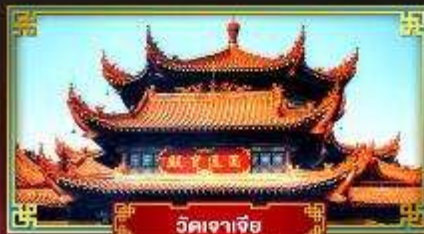
วัดเจาเจีย