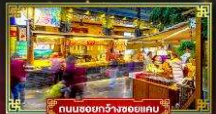
ถนนชอยกวางชอยแคบ