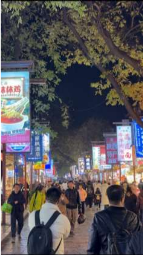
นำทุกท่านไป ถนนมุสลิม ( Muslim Quarter ) (ระยะทางประมาณ 500

เมตร ใช้เวลาเดินเท้าประมาณ 5 นาที) ย่านการค้าที่เต็มไปด้วยร้านอาหารและร้านค้าของชาวมุสลิม เป็นสถานที่ที่นักท่องเที่ยวสามารถสัมผัสวัฒนธรรมและชิมอาหารพื้นเมืองได้