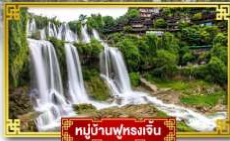
หมู่บ้านฟุทงเจิ้น