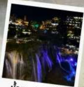
น้ำตกฟูหรงเจิ้น