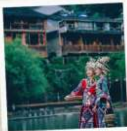
ชุดพื้นเมืองฟิ่งหวง