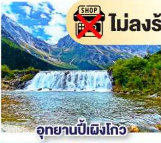
อุทยานปี้เฝิงโกว