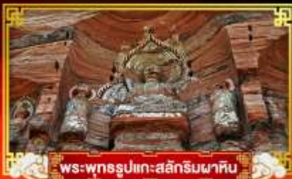
พระพุทธรูปแกะสลักหินผาศิน