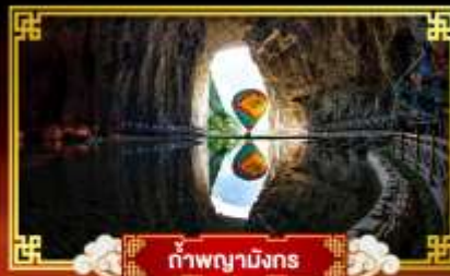
กำแพงงามังกร