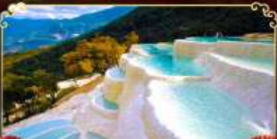
ไป๋ซู่โก

นั่งกระเช้าขึ้นหุบเขาพระจันทรสีน้ำเงิน ชมวิว "นาพาไห่" ทะเลสาบทุ่งหญ้าที่ดีที่สุด