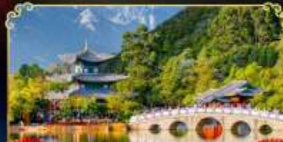
สระมิงกรต้า