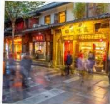
ถนนชอยกว้างแคบ