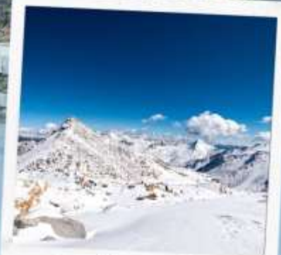
ภูเขาหิมะการ์เซีย ท่ากู่ปิงชวน