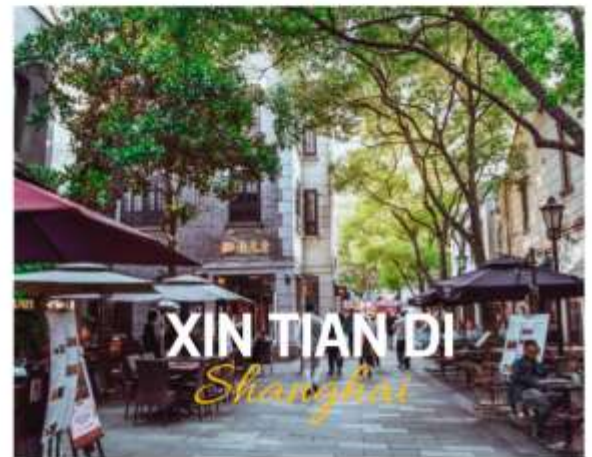
XIN TIAN DI Shanghai

ย่านใหม่ใจกลางเมืองเซี่ยงไฮ้ อีก 1 ย่านช้อปปิ้งและร้านอาหาร ร้านอาหารที่มีเอกลักษณ์ จากสถาปัตยกรรมที่ใช้อิฐบล็อกแบบสถาปัตยกรรมชิคเก๋มึน ซึ่งเป็นการผสมผสานกันระหว่างสถาปัตยกรรมจีนกับตะวันตกเข้าด้วยกัน ท่านจะพบกับทางเดินหิน กำแพงหิน ประติมากรรมที่มีเอกลักษณ์ โดย 2 ทางของถนนมีต้นเมเปิ้ลตลอดทาง ยิ่งทำให้ย่านนี้มีเสน่ห์เพิ่มเป็นเท่าตัว