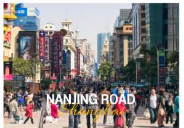
NANJING ROAD Shanghai

ถนนหนานจิง หรือที่รู้จักกันอีกชื่อว่า นานกิง ย่านช้อปปิ้งที่เก่าแก่และมีชื่อเสียงที่สุดในเซี่ยงไฮ้เลยในตอนเย็นจะเป็นช่วงที่ร้านค้าและบาร์ต่างๆกำลังคึกคักมีนักดนตรีริมถนนเต็มไปด้วยแสงสีเสียงเหมาะกับการเดินเล่นหรือนั่งรถรางชมบรรยากาศรอบๆฝั่งตะวันตกจะมีห้างสรรพสินค้าใหญ่ๆสลับกับร้านแบบจีนดั้งเดิมอยู่ตลอดสองข้างทาง