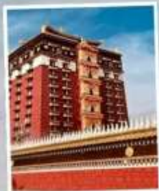
หอเก็บพระไตรปิฎก มิลารเปะ