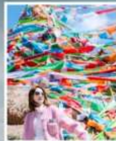
กุเขาสุริยันจันตรา