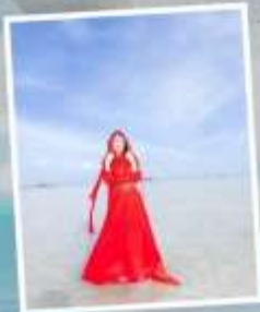
ทะเลสาบเกลือดาซ่า