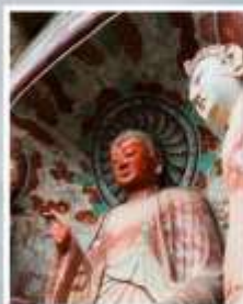
วัดปังหลังชื่อ