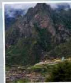
หมู่บ้านจากาน่า