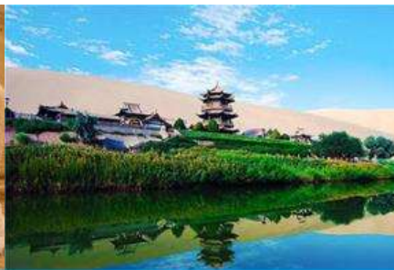
สระบัววังพระจันทร์