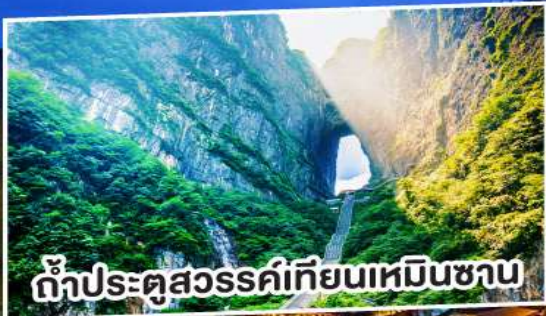
ถ้ำประตูสวรรค์เทียนเหมินชาน