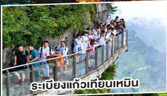
ระเบียงแก้วเทียนเหมิน