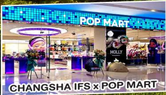
CHANGSHA IFS x POP MART