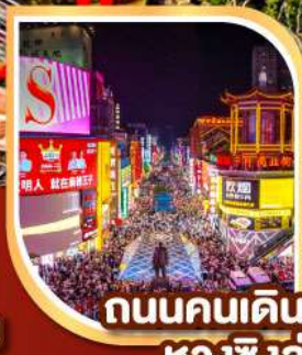
ถนนคนเดิน หวงซิงลู่