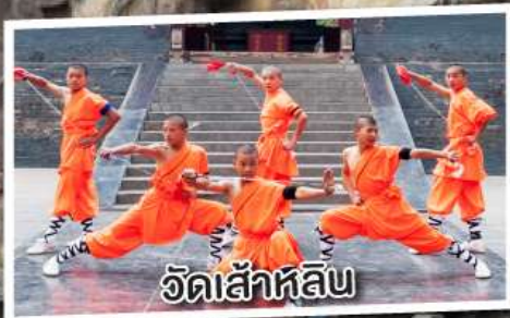
วัดเส้าหลิน