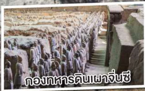
กองทัพดินเผาจีนซี