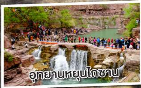
อุทยานหยุนโกซาน