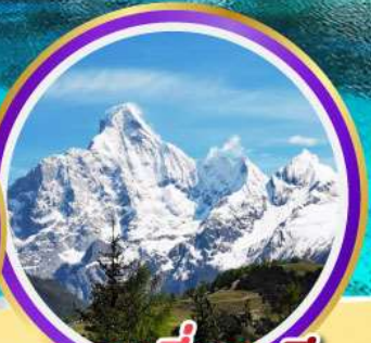
กุเวาสีครุณี