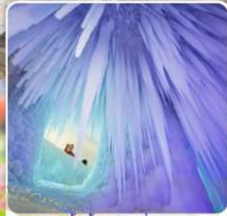
ถ้ำน้ำแข็งหมื่นปี