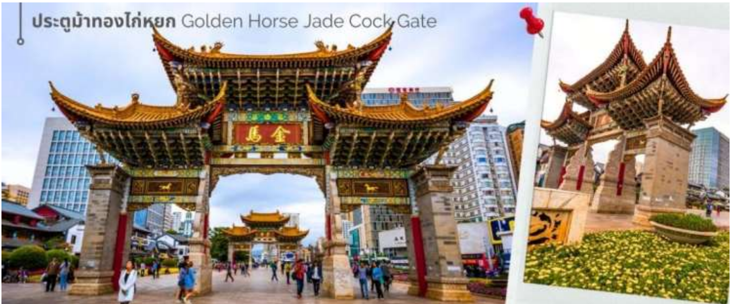
ประตูม้าทองไก่อหยก Golden Horse Jade Cock Gate

ชม ชุมประตุม้าทอง และ ชุมประตูไก่อหยก ซึ่งภาษาจีนเรียกว่าจินหม่า และปี้จี้ จิ้งเออคำย่อ จินปี้ มาชานานนาม ถนนแห่งนี้ ชุมม้าทองและไก่อหยก มีอายุร่วม 400 ปี สร้างขึ้นในสมัยราชวงศ์หมิง ในถนนย่านการค้าแห่งนี้ เป็น แหล่งเสื้อผ้าแบรนด์เนมทั้งของจีนและต่างประเทศ รวมทั้งเครื่องประดับ อัญมณี ร้านเครื่องดื่ม และร้านขายของที่ระลึกมากมาย