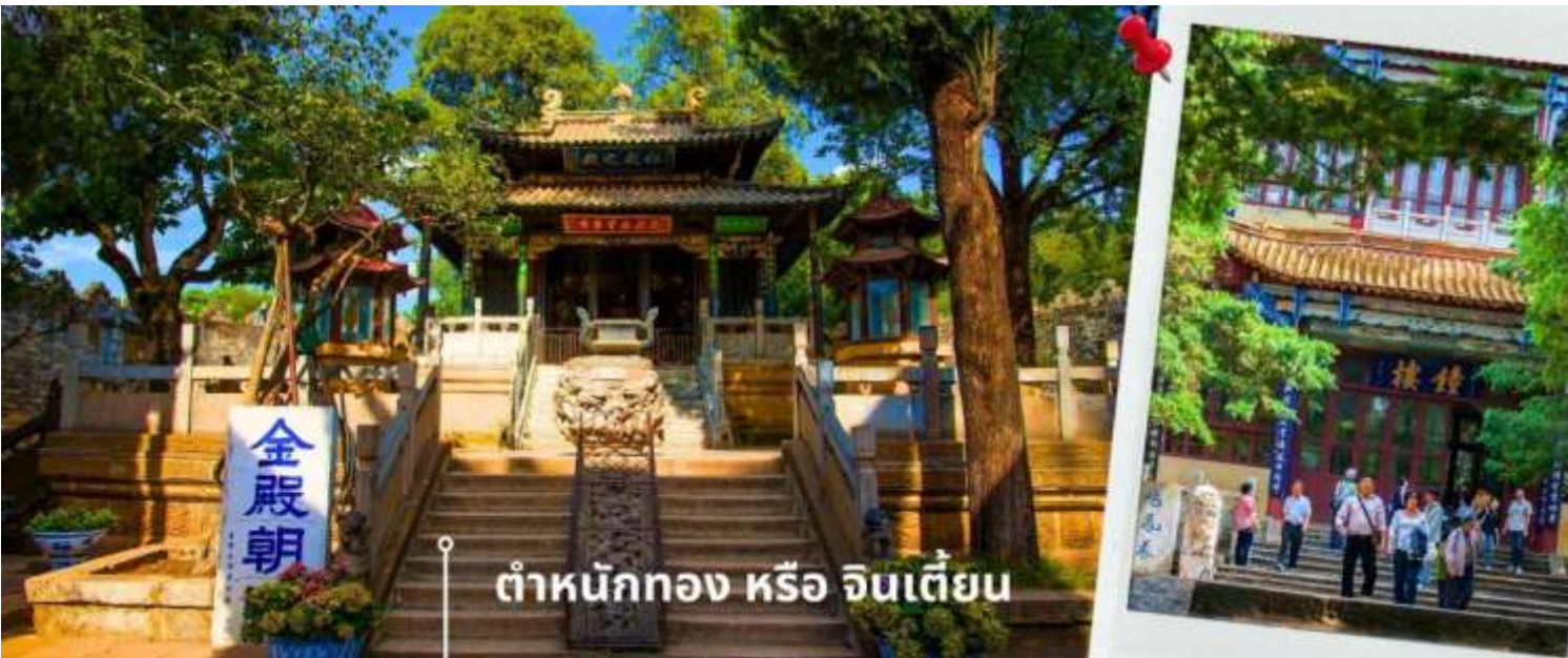
ดำหนักทอง หรือ จินเตี้ยน

00.15 เดินทางถึง สนามบินเมืองคุนหมิง ประเทศจีน หลังจากนั้นนำท่านผ่านด่านตรวจคนเข้าเมือง รับกระเป๋าสัมภาระ หลังจากนั้นเดินทางเข้าโรงแรมที่พัก ( เวลาที่ประเทศจีนเร็วกว่าประเทศไทย 1 ชั่วโมง ) ☞ เดินทางเข้าที่พัก WANJINAN HOTEL ระดับ 4 ดาว ท้องถิ่นหรือเทียบเท่า ☉ รับประทานอาหารเช้า ณ ห้องอาหารโรงแรม (1) นำท่านเยี่ยมชม ดำหนักทอง หรือ จินเตี้ยน (The Golden Temple Park | Jindian park) ( ไม่รวมค่ารถแบตเตอรี่ 10 หยวน/ท่าน ) โบราณสถานสำคัญของมณฑลยูนนาน ที่ได้รับการปกป้องดูแลโดยรัฐบาลจีน ตั้งอยู่บริเวณเชิงเขาหมิงเฟิง ล้อมรอบด้วยแนวกำแพงและหอคอยเหมือนเป็นป้อมปราการ ดำหนักทองถูกเรียกตามลักษณะอาคารที่มีสีทองอร่าม จากทองเหลืองในส่วนของผนังและหลังคา รวมกว่า 200 ตัน โดยถือเป็นสิ่งปลูกสร้างสัมฤทธิ์ที่ใหญ่