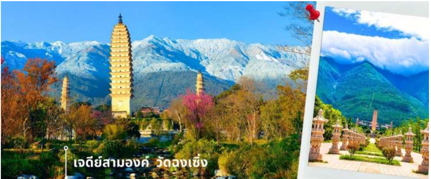
เจดีย์สามองค์ วัดจงเชิง

จากนั้นผ่านชม เจดีย์สามองค์ สัญลักษณ์ของเมืองต้าหลี่ ตั้งอยู่ภายใน วัดจงเชิง (Chongsheng Temple) วัดเก่าแก่ที่สร้างขึ้นเมื่อศตวรรษที่ 9 นับว่าเป็นหนึ่งในเจดีย์ที่สูงที่สุดในประเทศจีน อีกทั้งยังมีความศักดิ์สิทธิ์เป็นอย่างมาก ว่ากันว่าเป็นหนึ่งในสิ่งก่อสร้างเพียงไม่กี่แห่งที่ไม่ถูกทำลายจากเหตุการณ์แผ่นดินไหวในเมืองต้าหลี่เมื่อปี ค.ศ. 1925 จึงกลายเป็นสถานที่เคารพศรัทธาของชาวต้าหลี่เป็นอย่างมาก