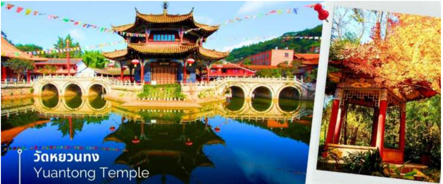
วัดหยวนทอง Yuantong Temple

ชม ชุมประตุม้าทอง และ ชุมประตูไก่อหยก ซึ่งภาษาจีนเรียกว่าจินหม่า และปี้จี้ จิ้งเออคำย่อ จินปี้ มาชานานนาม ถนนแห่งนี้ ชุมม้าทองและไก่อหยก มีอายุร่วม 400 ปี สร้างขึ้นในสมัยราชวงศ์หมิง ในถนนย่านการค้าแห่งนี้ เป็น แหล่งเสื้อผ้าแบรนด์เนมทั้งของจีนและต่างประเทศ รวมทั้งเครื่องประดับ อัญมณี ร้านเครื่องดื่ม และร้านขายของที่ระลึกมากมาย