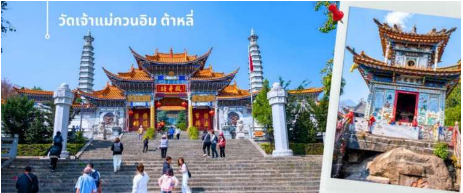
วัดเจ้าแม่กวนอิม ต้าหลี่

จากนั้นผ่านชม เจดีย์สามองค์ สัญลักษณ์ของเมืองต้าหลี่ ตั้งอยู่ภายใน วัดจงเชิง (Chongsheng Temple) วัดเก่าแก่ที่สร้างขึ้นเมื่อศตวรรษที่ 9 นับว่าเป็นหนึ่งในเจดีย์ที่สูงที่สุดในประเทศจีน อีกทั้งยังมีความศักดิ์สิทธิ์เป็นอย่างมาก ว่ากันว่าเป็นหนึ่งในสิ่งก่อสร้างเพียงไม่กี่แห่งที่ไม่ถูกทำลายจากเหตุการณ์แผ่นดินไหวในเมืองต้าหลี่เมื่อปี ค.ศ. 1925 จึงกลายเป็นสถานที่เคารพศรัทธาของชาวต้าหลี่เป็นอย่างมาก