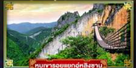
หุบเขารอยแยกอู่หลิงซาบ