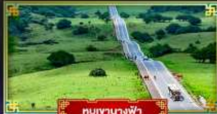
หุบเขานางฟ้า