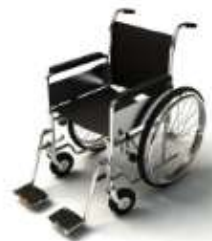
การรับการดูแลเป็นพิเศษ

กรณีผู้เดินทางต้องการความช่วยเหลือเป็นพิเศษ อาทิเช่น การใช้วีลแชร์ กรุณาแจ้งบริษัทฯ อย่างน้อย 7 วันก่อนการเดินทาง มิฉะนั้นบริษัทฯ จะไม่สามารถจัดการล่วงหน้าได้ เนื่องจากการขอวีลแชร์ในสนามบินนั้น ต้องมีขั้นตอนในการขอล่วงหน้า และบางสายการบินอาจมีการเรียกเก็บค่าใช้จ่ายทั้งทางสนามบินในไทยและในต่างประเทศ ซึ่งผู้เดินทางสามารถสอบถามกับเจ้าหน้าที่ได้โดยตรงก่อนทำการจอง และหากในคณะของท่านมีผู้ต้องการดูแลพิเศษ เช่น ผู้ที่นั่งรถเข็น (Wheelchair), เด็ก, ผู้สูงอายุและผู้ที่มีโรคประจำตัวหรือไม่สะดวกในการเดินทางท่องเที่ยวในระยะเวลาเกินกว่า 4 - 5 ชั่วโมงติดต่อกัน ท่านและครอบครัวต้องให้การดูแลสมาชิกภายในครอบครัวของตนเอง เนื่องจากการเดินทางเป็นหมู่คณะ หัวหน้าทัวร์มีความจำเป็นต้องดูแลคณะทัวร์ทั้งหมด