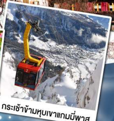
กระเช้าข้ามหุบเขาแกมมีพาส