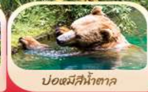
ปอแตมีสีน้ำตาค