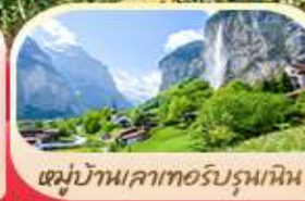
หมู่บ้านเลาเทอร์บรุนเนิน