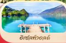
ไอชลทัวอลด์