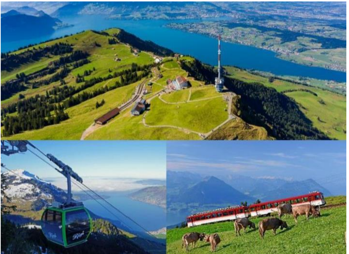
กลางวัน รับประทานอาหารกลางวัน ณ ภัตตาคารอาหารพื้นเมืองบนยอดเขา

จากนั้นนำท่าน นั่งรถไฟใต้เขาริกิ (Rigi) ที่ถือได้ว่าเป็นรถไฟใต้เขาที่เก่าแก่ที่สุดในยุโรป ที่เรียกได้ว่าเป็นรถไฟสายแรกของสวิตเซอร์แลนด์เลยก็ว่าได้ และยังเป็นอันดับ 2 รองจากยอดเขาวอชิงตัน ในมลรัฐนิวแฮมป์เชียร์ ในสหรัฐอเมริกา มีความสูงจากระดับน้ำทะเล 1,798 เมตร สู่ ยอดเขาริกิ (Rigi Kulm) มีที่มาจากคำว่า Mons Regina แปลได้ว่า "ราชินีแห่งขุนเขา" (Queen of the mountains) เพราะสามารถมองเห็นทิวทัศน์ของยอดเขาอื่นๆ ได้รอบ 360 องศา