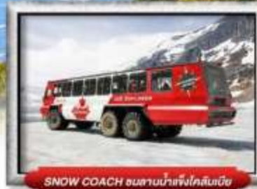
SNOW COACH ขนานน้ำแข็งใกล้หิมะ