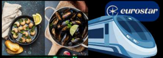
เมนูอาหารสุดพิเศษ !! หอยแมลงภู่อบไวน์ขาว และหอยเอสคาโก้ รถไฟความเร็วสูง จาก เบลเยียม สู่ ฝรั่งเศส