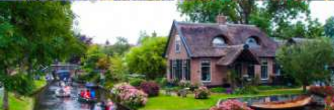
ล่องเรือชมหมู่บ้านกีร์รุน

สายการบินการตาร์แอร์เวย์ บินเข้า อัมสเตอร์ดัม บินออก ปารีส น้ำหนักกระเป๋า 25 กก.