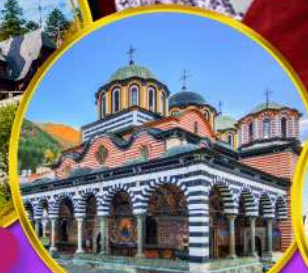
อารามมรดกโลกริล่า