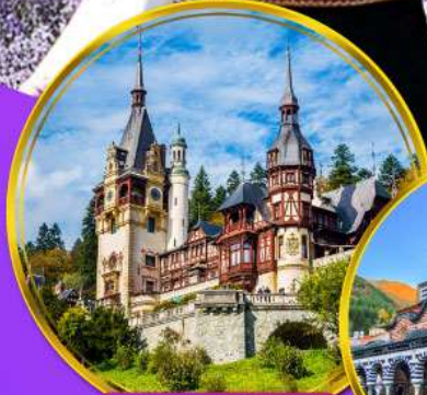
ปราสาทเปเลส