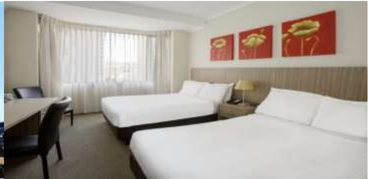
(โรงแรมย่านกลางเมือง ใกล้แหล่งช้อปปิ้ง เดินทางสะดวก) *รูปภาพเพื่อการโฆษณา*